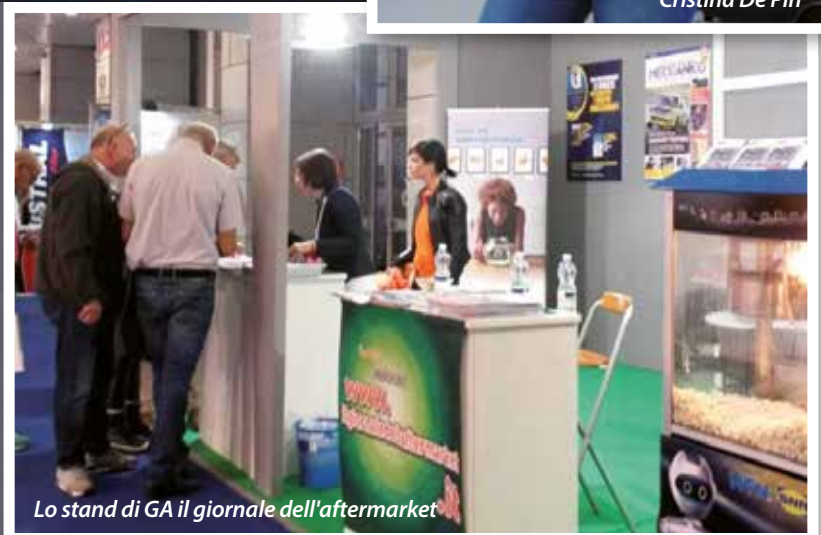
Lo stand di GA il giornale dell'aftermarket

to sul mondo del post vendita automobilistico in Italia, così come nei principali paesi strategici, a ulteriore supporto da parte degli organizzatori alla crescita professionale del mercato e dei suoi attori. Tra i 20 appuntamenti di AutopromotecEDU e altri 33 fra eventi, incontri e workshop organizzati da associazioni, istituzioni e riviste, si è svolto nella giornata del 20 maggio anche il convegno del Programma GM-EDU coordinato dalla nostra testata de il giornale del meccanico. Oltre 700 persone - il futuro della riparazione- erano presenti presso la sala Pegaso, per condividere i temi del convegno "Da autoriparatore a meccatronico: un'opportunità per i giovani". Passione, determinazione, voglia di fare sono state alla base delle presentazioni che avevano tutte l'obiettivo di far capire ai ragazzi, i futuri autoriparatori, che solo attraverso tanto impegno potranno ottenere eccellenti risultati. Ma l'opinione di chi, come molti di noi, era presente alla manifestazione bolognese può delineare un quadro completo dell'andamento della fiera. Diamo quindi la parola a chi era presente e ha voluto darci una concreta testimonianza.