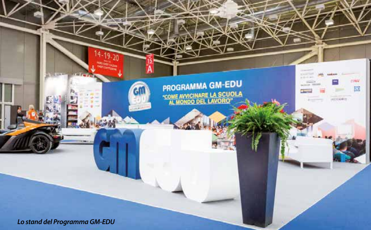
Lo stand del Programma GM-EDU