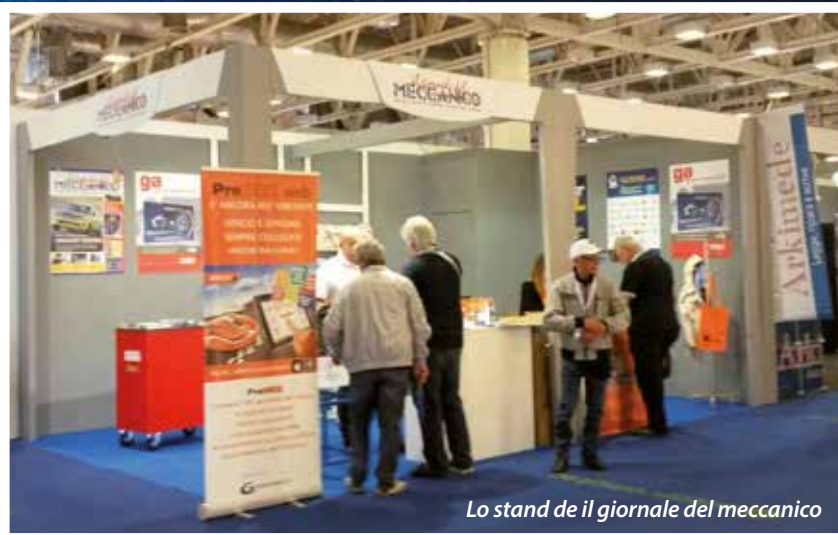
Lo stand de il giornale del meccanico