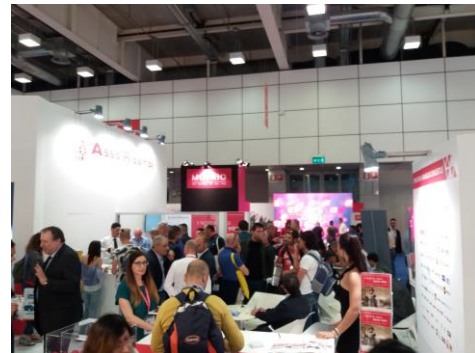
Foto 2: Stand di Asso Ricambi, un ampio spazio espositivo di 136 mq