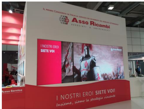
Foto 1: Stand di Asso Ricambi, un ampio spazio espositivo di 136 mq