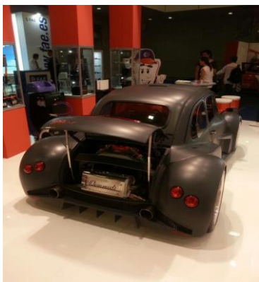
Foto 5: la Fiat500 con motore Lamborghini esposta nell'area Asso Service