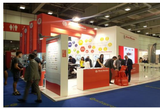
Foto 4: L'area dello stand dedicata al Programma Officine Asso Service